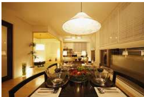
Dタイプ・モデルルーム（リビングダイニング）

モデルルーム等のご案内は、現地にて毎週日曜日に完成に先駆けまして実際のお部屋の見学会を開催させて頂いております。お部屋内と南面バルコニーを合わせると 37 坪超ものゆったりとした広さが魅力の D タイプ（東南角 4LDK）をモデルルームとして、また、収納性とランドリーテラスが奥様に人気の A タイプ（南西角 3LDK）と、プライバシーとパブリック性に配慮した間取りが特徴的な B タイプ（南向き 3LDK）の実際のお部屋をお気軽に見学いただけます。いずれもファミリー様をはじめ、幅広いライフスタイルの方に好評の住戸タイプです。皆様のご来場を心よりお待ちしております。