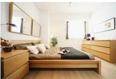
Dタイプ・モデルルーム（ベッドルーム）