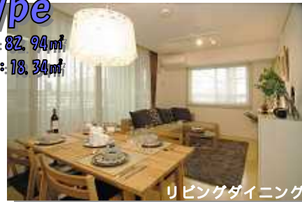
リビングダイニング