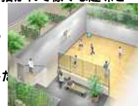
<ファミリーアリーナ>

1 階には、ファミリーアリーナ（ミニ体育館）もございますので、休日のちょっとしたひとときをご家族でのんびりお寛ぎ頂けます。